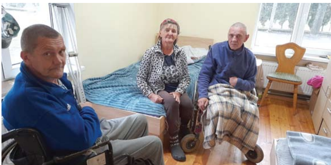
Daug gyvenimo negandų matę žmonės džiaugiasi turėdami jaukius namus.

įsigijo šį, labai prastos būklės pastatą Troškūnų miestelyje iš Anykščių rajono savivaldybės. „Šie namai buvo pastatyti 1939 metais, turint tikslą prižiūrėti senelius, kuriais rūpinosi vienuoliai. Senoliai čia gyveno tik metus laiko, nes atvykę okupantai visus senelius išvežė į mišką sušaudyti. Kiek vėliau buvo mokykla, bendrabutis, laidojimo nnamai. Nuostabu tai, kad po tiek metų mes vėl tęsiame Dievo darbą rūpintis vargšais. Kai pradėjome veiklą, čia nebuvo nieko: nei sanmazgo, nei paruoštų gyventi kambarių.