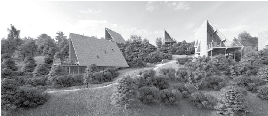
Poilsio pastatų vizualizacijos.

Miesto K. Būgos gatvėje mažoji bendrija „Kidi“ neseniai rekreacinės paskirties sklype taip pat pastatė keletą poilsio paskirties namukų, tačiau po to, kai mažoji bendrija kreipėsi į Anykščių rajono tarybą su prašymu išsinuomotą sklypą su namukais perleisti kitiems savininkams, tarp Tarybos narių kilo nepasitenkinimas. Anykštėnų išrinktieji įžvelgė, kad verslininkai, rekreacinės paskirties sklypuose statydami namukus, o ne SPA centrus ar viešbučius, Anykščių miestui neatneša naudos, o minėti namukai esą gali virsti užslėptais gyvenamosios paskirties statiniais.