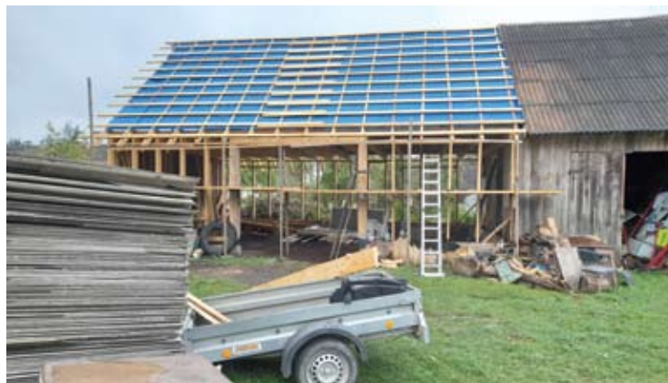
Buvęs kluonas ateityje gal taps dirbtuvėmis.