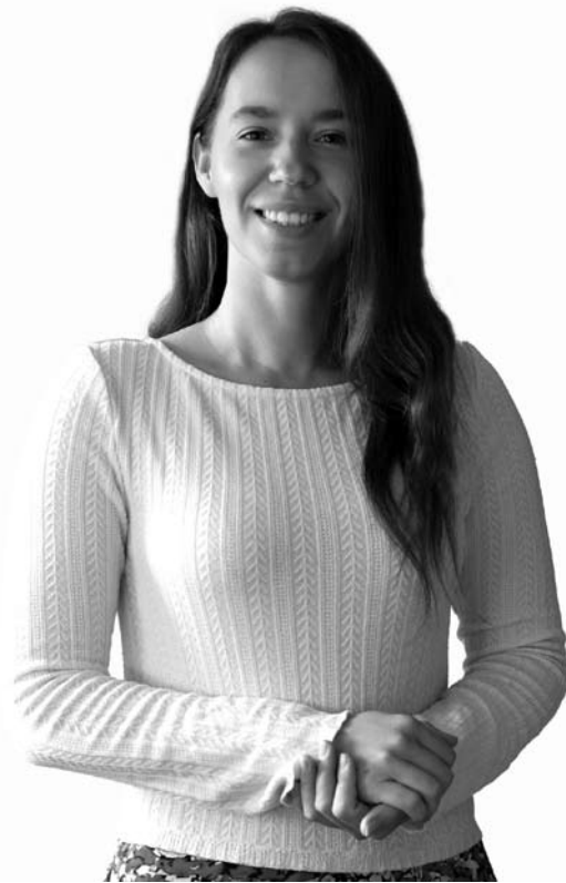
RPLC specialistės teigimu, Lietuvoje dažniausiai žmonės kreipiasi pagalbos dėl priklausomybės nuo alkoholio.

„Alkoholio vartojimas lietuvių visuomenėje yra tapatinamas su vertybėmis. Tai labiausiai atsiskleidžia alkoholinių ir nealkoholinių gėrimų reklamose, kur apeliuojama į bendrystę, vienybę,